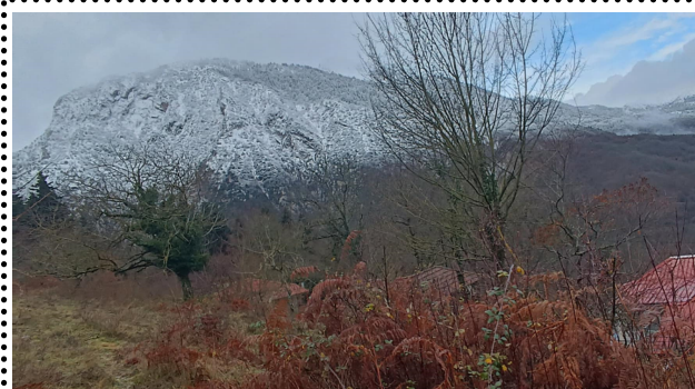
Τα πρώτα χιόνι στο χωριό μας, στην πέριξ ορεινή ζώνη.

Μπαλτή Ουρανία τοπική σύμβουλος Νεραΐδας.